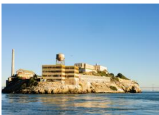
San Francisco 📍