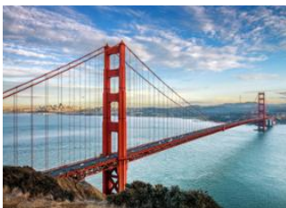
San Francisco 📍