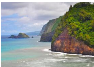
Hilo, Big Island 📍