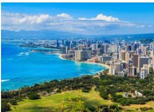
Honolulu, Oahu 📍