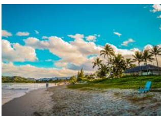
Hilo, Big Island 📍