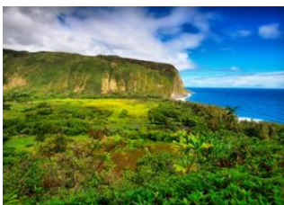
Hilo, Big Island 📍