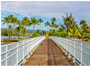
Hilo, Big Island 📍