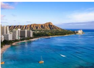
Honolulu, Oahu 📍