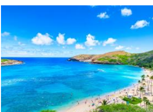
Honolulu, Oahu 📍