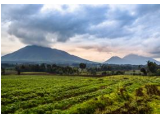
Hilo, Big Island